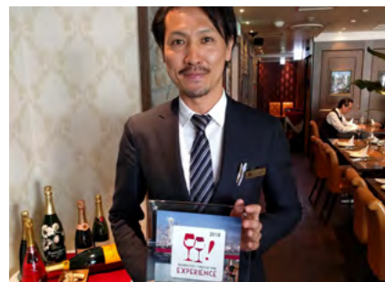
tcc Steak & Seafood