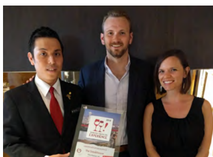
ANA INTERCONTINENTAL ザ・ステーキハウス