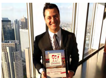
Park Hyatt New York Grill & Bar