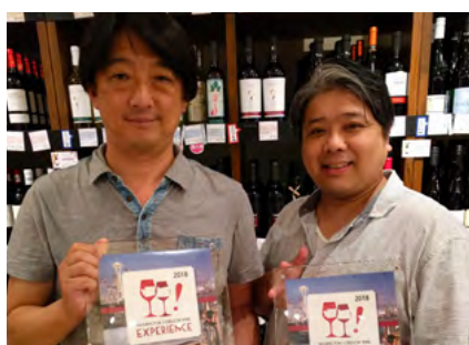
株式会社 鷺谷商店