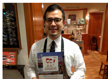
WINE MARKET PARTY