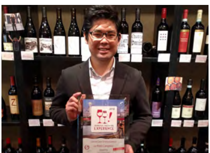
ル・プティ・コントワール