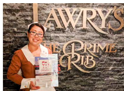
ロウリーズ ザプライムリブ 恵比寿