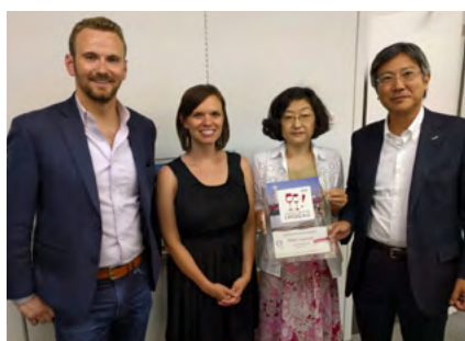
ワインキュレーション株式会社